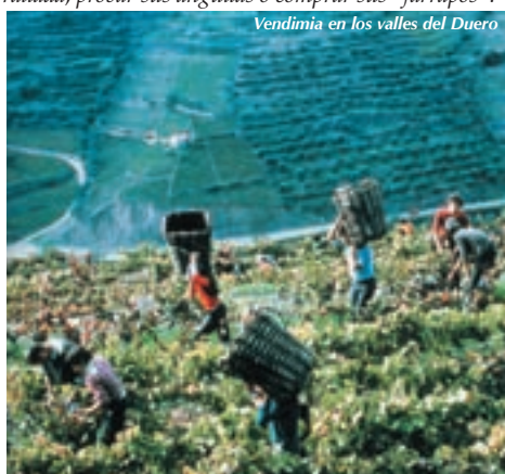
Vendimia en los valles del Duero

Valença do Minho. Separada o unida al río Miño con la Tui gallega, merece un alto para visitar su fortaleza amurallada, probar sus anguilas o comprar sus "farrapos".