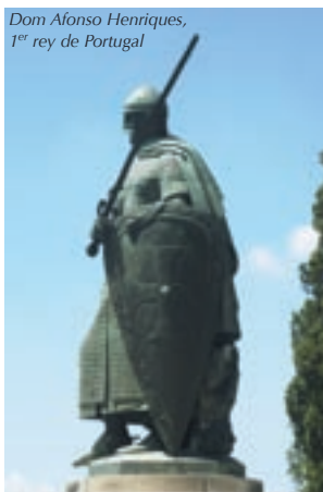
Dom Afonso Henriques, 1 er rey de Portugal

Póvoa de Lanhoso. Sobre un tolmo granítico, sigue airosa la torre del homenaje y parte amurallada del castillo (testigos del cerco de doña Urraca a su hermana Teresa). Justo al lado de la calzada