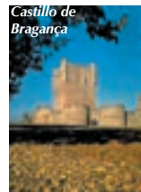
Castillo de Bragança

Braga. "La Roma portuguesa" es una joya monumental (catedral, iglesias, edificios civiles; santuarios de Sameiro y Bom Jesús do Monte; alrededores monumentales de muy diversas épocas). Imprescindible. Carnes, bacalao, dulces; cerámica, bordados; vino verde.