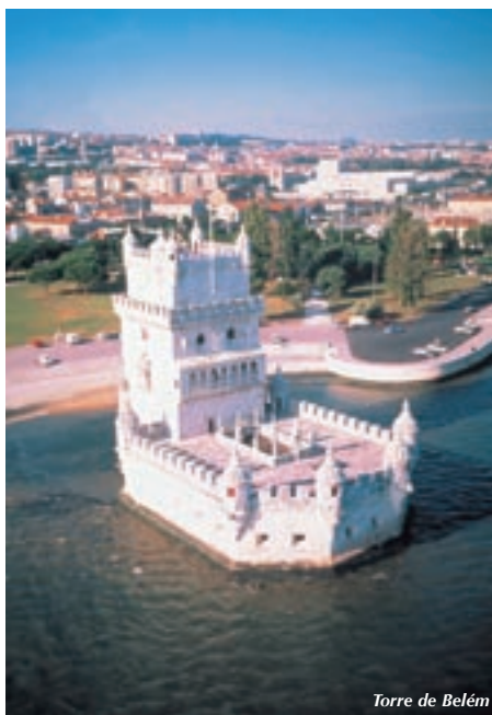
Torre de Belém

Aglomerado, laberíntico, empinado. Necesariamente contemplaremos la casa de las puntas de diamantes ("bicos"), la catedral, el castillo de São Jorge, el monasterio-panteón de San Vicente de Fora (dinastía de los Bragança y patriarcas de Lisboa), el Campo de Sta. Clara y su "feira de Ladra" los martes y sábados; la iglesia-panteón de Sta. Engracia (portugueses ilustres) y, más allá, la iglesia Madre de Deus y su museo del Azulejo.