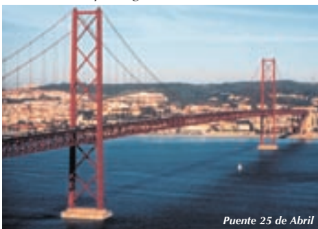
Puente 25 de Abril

El barrio más comercial y bullicioso. Desde el muelle de las Columnas y la plaza del Comercio casi hasta Pombal, entre las aréolas de São Jorge y del Chiado. En un desplante torero, con el Tajo a la espalda, pasear los cinco sentidos hasta la plaza de Dom Pedro IV, el teatro de Dona María II, la estación del Rossío, la plaza y obelisco de los Restauradores; subir el largo cuello de la avenida de la Libertad hasta la cabeza del Marqués de Pombal y el inmediato parque de Eduardo VII con su invernadero ("Estufa"). De vuelta a Restauradores, tomar el funicular de Lavra o el de Gloria; ya en Rossío, subirse al ascensor de Santa Justa, que nos dejará en las ruinas del Carmen y Museo Arqueológico.