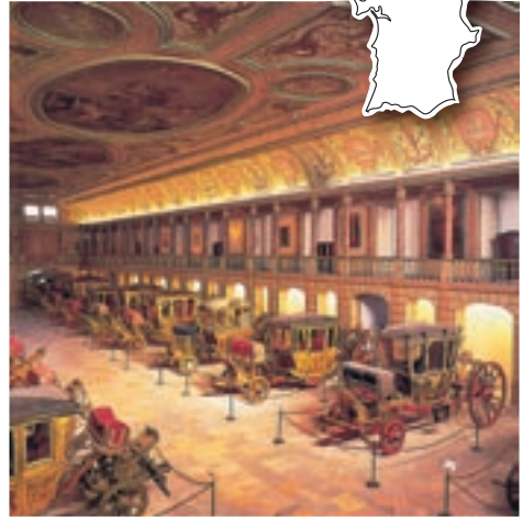
Museo de los carruajes

Hubo un tiempo en que muchos españoles sabían de Portugal poco más que el rizo de sus toallas y albornoces. Todo ello fue historia, a veces “novelesca y novelada”. Lisboa siempre tuvo clase, y ello se percibe en esta “ciudad de compras”, sobre todo si las buscamos en la Baixa Pombalina, en el Chiado y en grandes centros comerciales, como Amoreiras o Colombo.