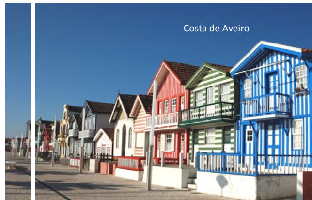
Costa de Aveiro