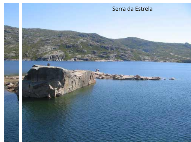
Serra da Estrela