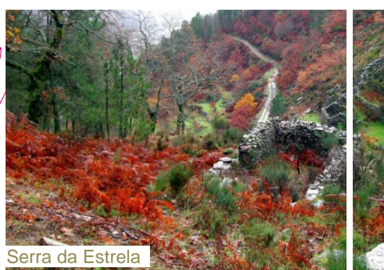
Serra da Estrela