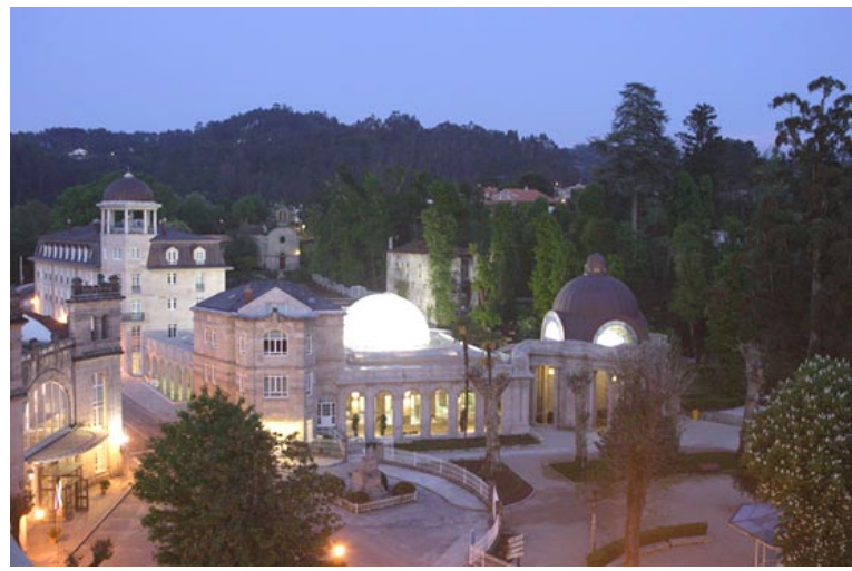
Las Caldas Villa Termal ***** (Las Caldas-Oviedo) & Balneario de Mondariz **** (Mondariz-Pontevedra)